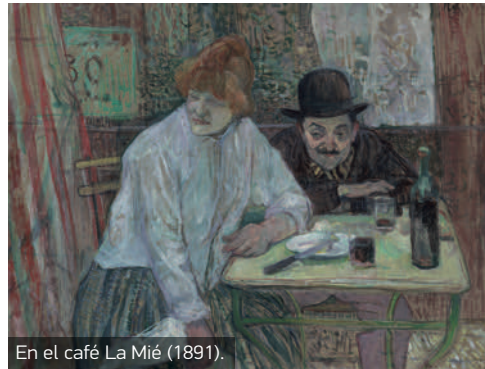
En el café La Mié (1891).