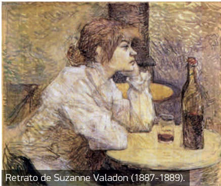
Retrato de Suzanne Valadon (1887-1889).