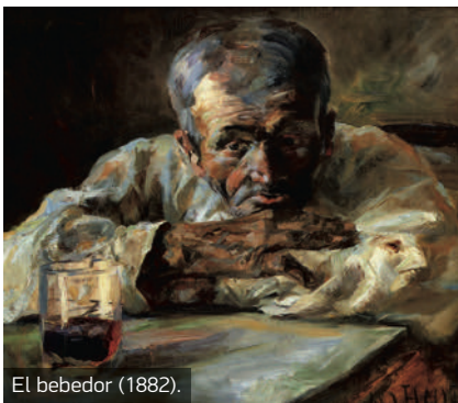
El bebedor (1882).

En la mesa no había coto para los vinos de alta calidad. No era el pintor pobre de la imagen manida y su fortuna le permitía hacer ciertos dispendios y acumular conocimientos de depurado catador. Se le atribuye la descripción del vino que "hace en la garganta el mismo efecto que la caricia de una pluma de pavo real", que reservaba a los vinos de la mejor calidad. ■ MNÑ