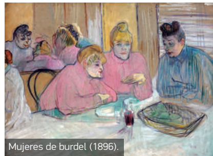
Mujeres de burdel (1896).

yale, y frecuentó todo tipo de cafés, cabarés, prostíbulos, teatros y otros antros de perdición. Tuvo especial relación con el legendario Le Moulin Rouge , para el que pintó toda una serie de carteles en los que se anunciaban las artistas punteras del momento: Jane Avril, Yvette Guilbert y sobre todo Louise Weber, La Goulue , con la que al parecer mantuvo una relación amorosa.