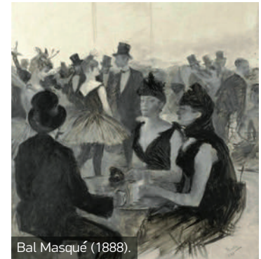
Bal Masqué (1888).

Lautrec, que hubo de ser hospitalizado para recibir una cura a su adicción y murió alcoholizado y que plasmó el consumo de bebidas, incluso inmoderado, en algunas de sus obras más famosas. Ese contraste se plasma en su pintura: llenos de luz y fiesta los carteles con los que se anunciaban los numerosos teatros que abrían sus puertas en el París de hace un siglo; sórdidos los del otro lado, retratos de seres degradados y de petimetres elegantes y adinerados que poblaban, como él mismo, las sombras de los cabarés y de los burdeles parisinos.