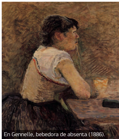
En Gennelle, bebedora de absenta (1886).

Tal vez por mantener la exposición en los límites de lo políticamente correcto (el nue-