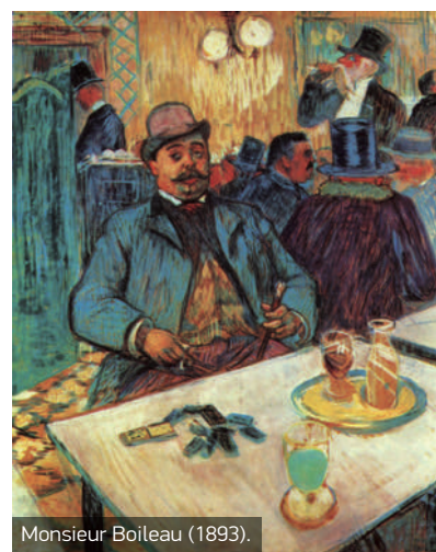
Monsieur Boileau (1893).